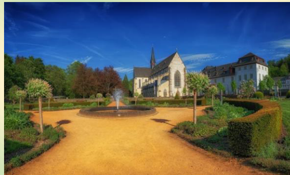
Zisterzienserabtei Marienstatt 57629 Marienstatt